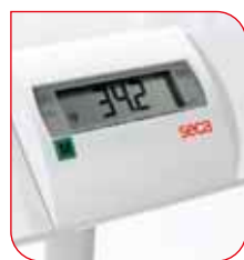
Le BMI du patient peut être calculé après avoir entré sa taille.

La fonction Indice de Masse Corporelle (BMI) de la balance seca 635 permet de déterminer facilement le statut nutritionnel du patient afin de prendre des mesures précoces. L'extinction automatique intégrée éteint automatiquement la balance après utilisation lorsqu'elle est alimentée par piles afin de prévenir toute consommation d'énergie inutile.